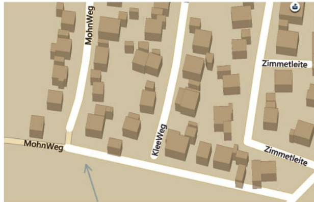
Erneueres Teilstück am Dietenhöfener Weg

Liebe Mitbürgerinnen und Mitbürger, in den letzten Wochen konnten von den Mitgliedern der Jagdgenossenschaft Großhabersdorf die zwei rechts abgebildeten landwirtschaftlichen Wegabschnitte ausgebaut werden. Die Auswahl dieser Wegabschnitte wurde bewusst so gewählt, dass für die Anwohner dieser landwirtschaftlich genutzten Ortseinfahrtsstraßen zukünftig mit einer Reduzierung der Staub- und Schmutzbelastung zu rechnen ist. Als oberste Trageschicht wurde keine Teer- oder Schottererschicht gewählt, sondern die Auswahl fiel auf ein aus dem Straßenbau anfallendes Recyclingprodukt, das auch weiterhin die Eigenschaft der Wasserdurchlässigkeit besitzen soll und das bei einer Befahrung zu einer erheblich niedrigeren Staub- und Lärmentwicklung führen soll. Dieser verwendete Recyclingbaustoff unterliegt der Qualitätssicherung des TÜV-Rheinland für die einzuhaltenden wasserwirtschaftlichen Gütemerkmale. Diese Maßnahme erfolgte auch mit der Zustimmung des Landratsamtes (Sachgebiet Umweltschutz).