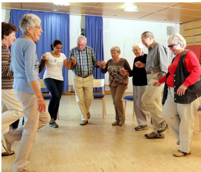
Balanceübungen für eine bessere Trittsicherheit

Weißensteinstraße 70 - 72 34131 Kassel Telefon: 0561 785-0 Internet: www.svlfg.de E-Mail: kommunikation@svlfg.de Pressesprecher: Dr. Erich Koch Telefon: 0561 785-12142 Martina Opfermann-Kersten Telefon: 0561 785-16183