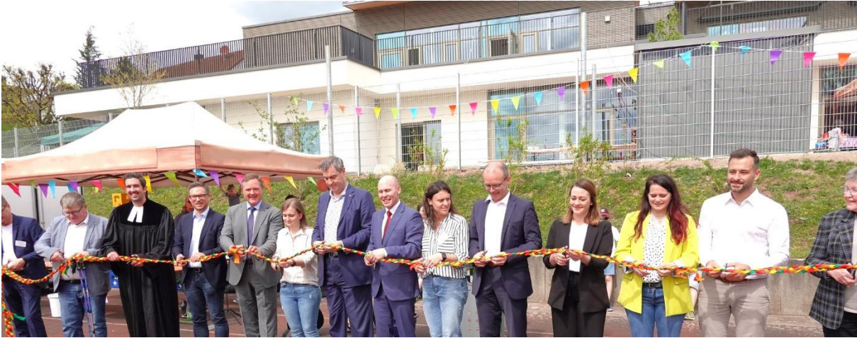
Das symbolische Durchschneiden eines Eröffnungsbandes für die Übergabe der Kita an unseren Träger soll den weitestgehenden Abschluss der Arbeiten markieren.

Mit diesem ganz besonderen Tag starteten wir zusammen in ein neues Abenteuer. Dort im Kindergarten Biber(t)bande werden unsere Kleinen nicht nur lernen, sondern vor allem auch spielen, lachen, sich entdecken und als Gruppe zusammenwachsen. Zusammen mit unserem Träger, der evangelischen Kirche, sind wir davon überzeugt, für all das die besten Voraussetzungen und einen ansprechenden Rahmen geschaffen zu haben.