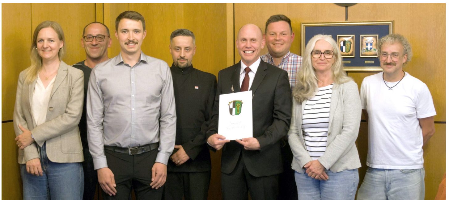
Foto: Die neu vereidigten Mitglieder des Gemeinderats