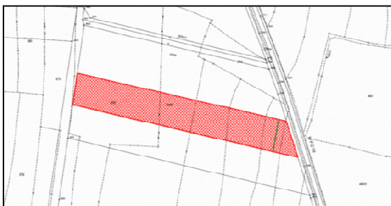
Neue aufgenommene Grundstücksfläche für den Verlust von Feldlerchenbrutflächen

Weiterhin wurde vom Gemeinderat in der Sitzung vom 30.06.2022 beschlossen, dass die 22. Fortschreibung des Flächennutzungsplans und der Bebauungsplan Nr. 41 „Bürgersolarpark Unterschlaubach“ öffentlich ausgelegt werden sollen.