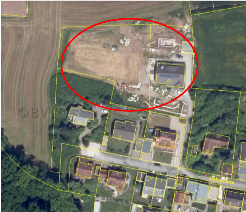
Luftbildkarte des Geltungsbereichs

Der Einbeziehungsbereich nördlich und westlich des Klarstellungsbereichs umfasst unbebaute Bereiche sowie im Bau befindliche Nebenanlagen. Der Einbeziehungsbereich ist durch die bauliche Nutzung angrenzender Flächen so geprägt, dass sich die künftige Bebauung gem. § 34 BauGB in die Eigenart der Umgebung einfügen lässt. Er grenzt direkt an eine zusammenhängende Bebauung an.