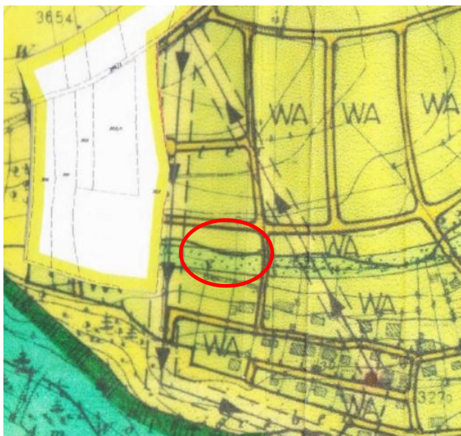
Ausschnitt Flächennutzungsplan und Landschaftsplan

Die Darstellung im Flächennutzungsplan entspricht damit grundsätzlich der geplanten Nutzung. Obwohl der FNP teils Flächen für einen Grünzug darstellt, ist die Planung mit einer geordneten städtebaulichen Entwicklung vereinbar. Die Grundkonzeption des Flächennutzungsplans bleibt unberührt. Die geringe Fläche die umgewidmet wird, ist als Konkretisierung der flächenunscharfen Prognose des Flächennutzungsplans zu sehen. Für das geplante Wohngebiet gibt es noch keine konkrete Planung, so dass auch die Lage des angedachten Grünzugs bzw. der Erschließung variabel ist. Dennoch wird in der gegenständlichen Planung durch Anordnung der Ausgleichsflächen und der Flächen mit Begrünungsbindung die Konzeption des Grünzugs aufgegriffen.